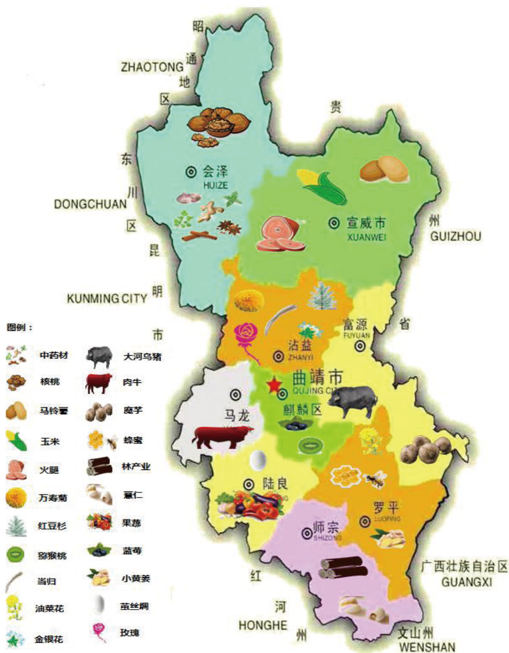
图3 曲靖市高原特色农业和生物产业布局图